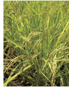
Fig. 2 Transfer of ^{137}\text{Cs} from soil to rice plant.